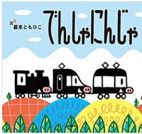
『でんしゃにんじゃ』 藤本ともひこ／作・絵 交通新聞社