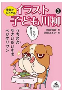
言葉がひろがる イラスト子ども川柳 3』 熊田松雄／編 岩間みどり／絵 汐文社