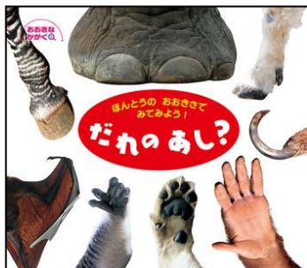
『ほんとうのおおきさでみてみよう！ だれのあし？』 ひさかたチャイルド