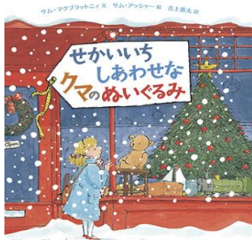
『せかいいちしあわせなクマのぬいぐるみ』 サム・マクブラットニィ／文 サム・アッシャー／絵 吉上恭太／訳 徳間書店