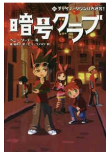
『暗号クラブ 15 チャイナ・タウンは大迷宮！』 ペニー・ワーナー／著 番由美子／訳 ヒョーゴノスケ／絵 KADOKAWA