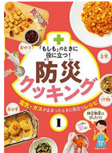
『「もしも」のときに役立つ！ 防災クッキング 1』 今泉マユ子／著 フレーベル館