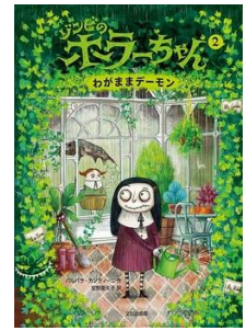
『ゾンビのホラーちゃん 2』 ハルバラ・カンティニー／作 安野亜矢子／訳 文化学園文化出版局