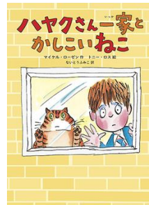
『ハヤクさん一家とかしいねこ』 マイケル・ローゼン／作 トニー・ロス／絵 ないとうふみこ／訳 徳間書店