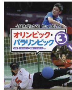
『全競技がわかる! 知って楽しい! オリンピック・パラリンピック 3』 日本オリンピック・アカデミー／監修 国土社編集部／編集 国土社