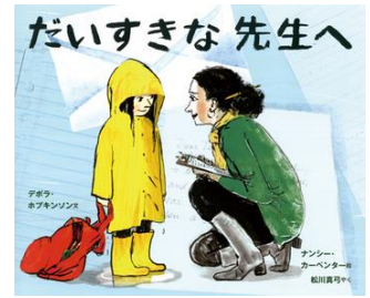
『だいすきな先生へ』 デボラ・ホプキンソン／文 ナンシー・カーペンター／絵 松川真弓／訳 評論社