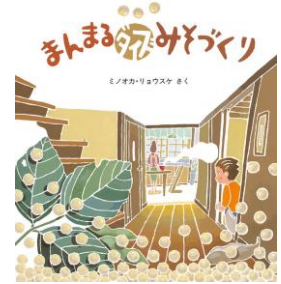
『まんまるダイズみそづくり』 ミノオカリョウスケ／作 福音館書店