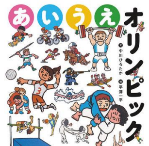
『あいうえオリンピック』 中川ひろたか／文 平澤一平／絵 大野益弘／監修 くもん出版