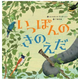
『いっぽんのきのえだ』 CONSTANS・ANDERSON／作 千葉茂樹／訳 ほるぷ出版