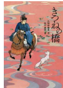
『きつねの橋』 久保田香里／作 佐竹美保／絵 偕成社