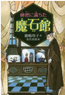
『秘密に満ちた魔石館』 廣嶋玲子／作 佐竹美保／絵 PHP 研究所