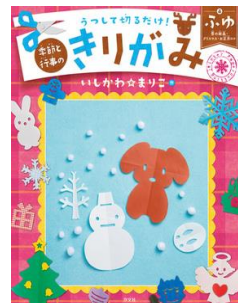
『うつつて切るだけ！ 季節と行事のきりがみ 4 ふゆ』 いしかわまりこ／作 汐文社