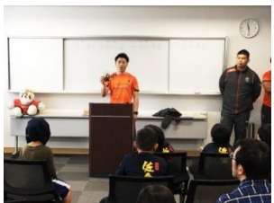
▲船橋市をホームタウンに活動し、市と「相互連携・支援協力に関する協定」を締結しているラグビートーム「クボタスピアーズ」と連携イベントを開催しました(左：選手によるおすすめ本の紹介、右：ギャラリー展示)