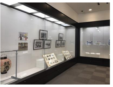
▲市内 4 図書館と船橋市観光協会 で巡回展「図書館資料に見る船橋の 80 年」を開催しました