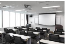
◀市民の皆様からご要望の多かった学習コーナーを設置。全35席(左) 多目的室では、図書館講座を毎月開催しました(右)