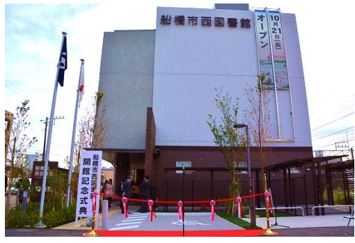
▲平成 28(2016)年 10月 21日、待ちに待ったリニューアルオープンの日を迎えました