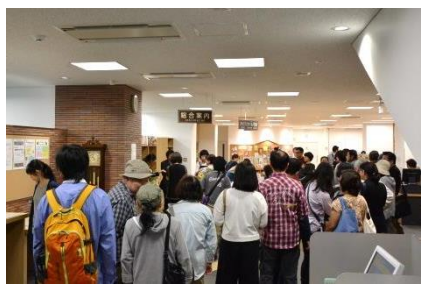
▲開館初日は多くの方が来館しました 1階カウンターは、利用券を登録する方で長蛇の列ができました