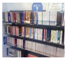
▲「セカンドブック事業～おいでよ！としょかん～」を開始し、子供たちが本に親しめる機会を増やしました ▲CDの貸出しを開始しました