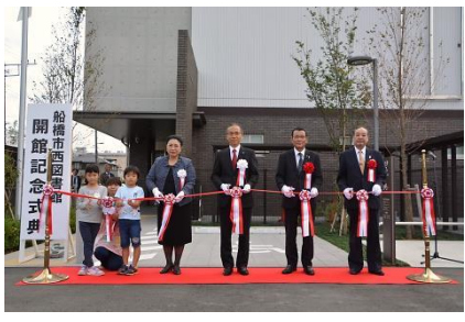
▲開館記念式典では、市長らによるテープカットが行われました